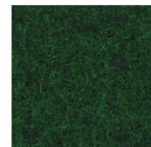
1531 Amazonia Green