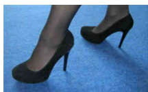
Chaussures / Shoes