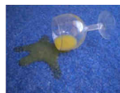
Liquides / Liquid