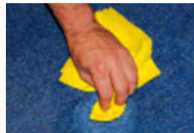
Nettoyage facile Easy cleaning