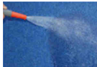
Jet d'eau Water jet