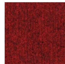
1632 Ruby Red