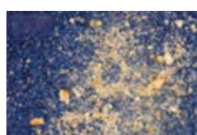
Salissures / Dirt