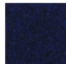
1534 Eclipse Blue