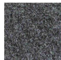
1005 Dark Grey