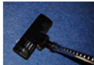
Aspiration Vacuum cleaning